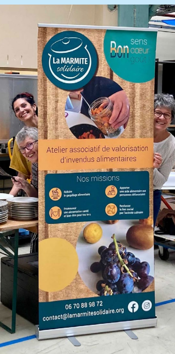
La Marmite solidaire

La volonté de développer des circuits courts d'approvisionnement a été pointée par les acteurs associatifs lors de l'étude comme une priorité. L'étude menée par SOLAAL devrait permettre d'identifier des gisements. Ce qui n'est pas sans poser de questions logistiques ou de transformation de denrées périssables.