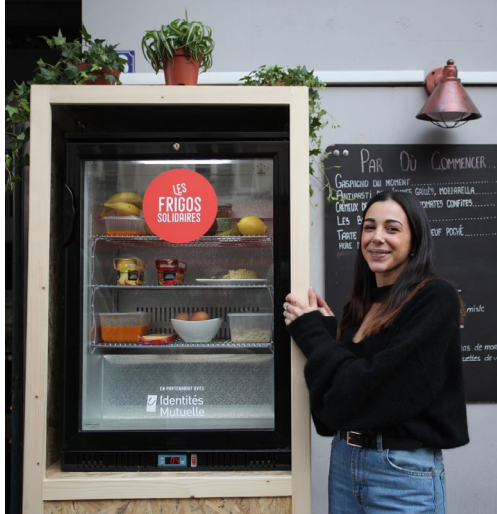
Les Frigos solidaires